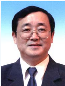
05 蔡跃波 水利部大坝安全管理中心副主任