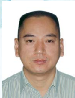
03 张严明 水利部水利建设与管理总站主任