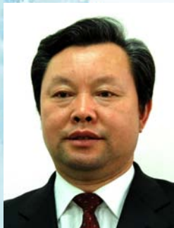
01 孙继昌 水利部建设管理司司长