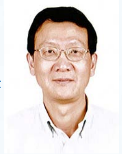
20 吕峰 浙江省水利厅科技外事处处长