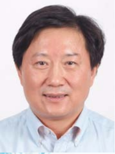
07 虞洁夫 浙江省水利厅副厅长