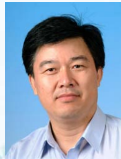
04 贾金生 中国水利水电科学研究院副院长