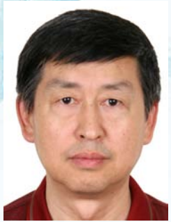
15 辛立勤 水利部水文局副局长